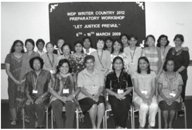
Das malaysische WGT-Komitee

Menschenrechte sind unteilbar: Wird ein Recht verletzt, hat das Auswirkungen auf die Verwirklichung der anderen Rechte. Mädchen können zum Beispiel ihr Recht auf Bildung in vielen Fällen nicht wahrnehmen. Infolgedessen haben sie keine Chancen auf dem formellen Arbeitsmarkt. Das wiederum verletzt ihr Recht auf Arbeit und eigenes Einkommen. Außerdem darf kein Mensch in der Verwirklichung seiner Rechte aufgrund von Nationalität, Geschlecht, ethnischer Herkunft, Hautfarbe, Religion oder Sprache diskriminiert werden. Die „Konvention zur Beseitigung jeder Form von Diskriminierung der Frau“ (CEDAW) wurde 1979 von der Generalversammlung der Vereinten Nationen verkündet und trat 1981 in Kraft. Die Konvention verpflichtet alle Vertragsstaaten, die Diskriminierung von Frauen zu verbieten und ihnen Zugang